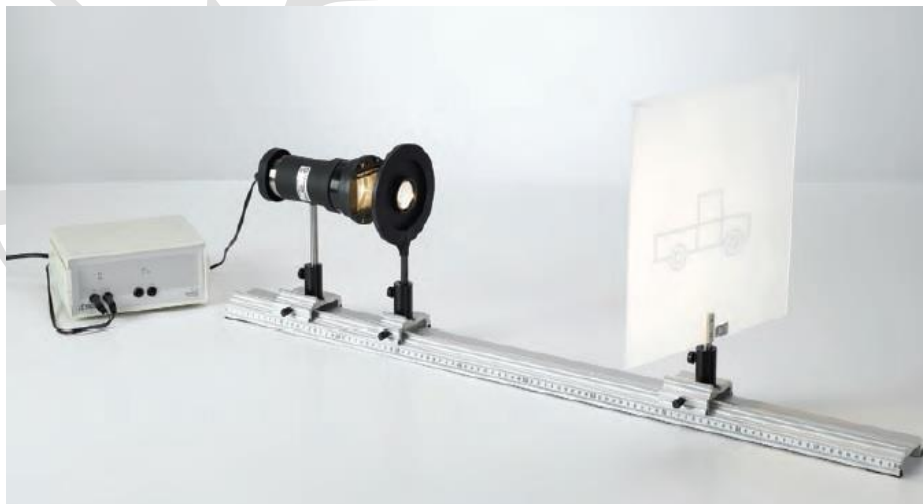
الشكل(1): الأجهزة المستخدمة في تجربة تحديد البعد المحرقي لعدسة مقربة باستخدام طريقة بيسل.

حيث أن s هو البعد ما بين المصباح واللوح.